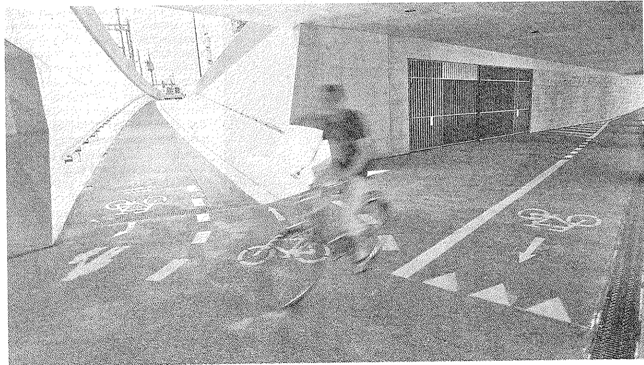
Ein provisorischer Steg bietet einen direkten Übergang. Vorsicht ist bei der unterirdischen Kreuzung geboten.